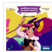
PEPA A LOBA (MULLERES BRAVAS) LEDICIA COSTAS; EVA AGRA