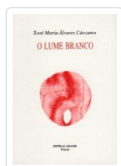
2.LUME BRANCO (POESIA) XOSE MARIA ALVAREZ CACCAMO