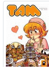
TAM ANEMONA DE RIO