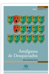
AMALGAMA DE DESQUICIADOS (RELATOS) MARTINEZ PEREIRO, X. L.