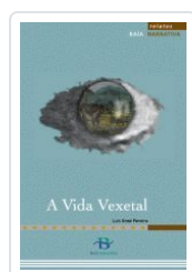
A VIDA VEXETAL (NOVELA) PEREIRA, LUIS XOSE