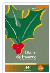
DIARIO DE INVERNO MARTINEZ OCA, X.M.