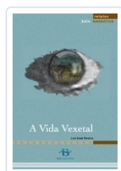
A VIDA VEXETAL (NOVELA) PEREIRA, LUIS XOSE