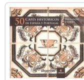
50 CAFES HISTORICOS DE ESPAÑA Y PORTUGAL FERNANDO FRANJO