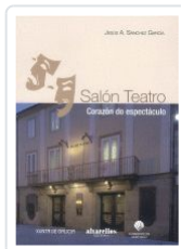
SALÓN TEATRO. CORAZÓN DO ESPECTÁCULO JESUS A. SANCHEZ GARCIA