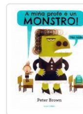
A MIÑA PROFE É UN MONSTRO! DISO NADA PETER BROWN