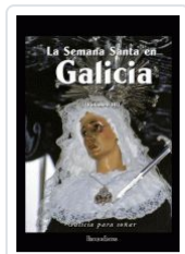
LA SEMANA SANTA EN GALICIA III. VV.AA.