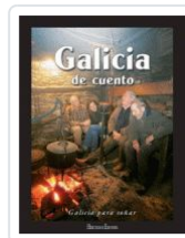
GALICIA DE CUENTO VV.AA.