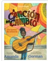
A CANCIÓN DO CAMBIO AMANDA GORMAN