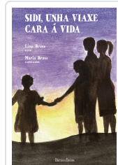
SIDI, UNHA VIAXE CARA Á VIDA BRAXE, LINO