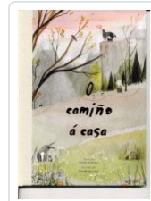
O CAMIÑO A CASA KATIE COTTON; SARAH JACOBY (ILU.)