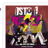
ISTO É ROCK! JAVIER BECERRA