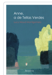
ANNE , A DE TELLAS VERDES LUCY MAUD MONTGOMERY