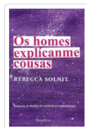
OS HOMES EXPLICANME COUSAS REBECCA SOLNIT