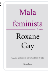
MALA FEMINISTA ROXANE GAY