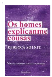
OS HOMES EXPLICANME COUSAS REBECCA SOLNIT