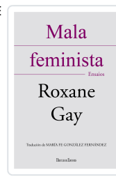
MALA FEMINISTA ROXANE GAY