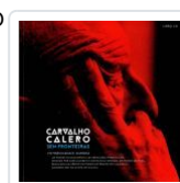
CARVALHO CALERO SEN FRONTEIRAS (INCLUE CD) FOTOBIOGRAFIA AA.VV.