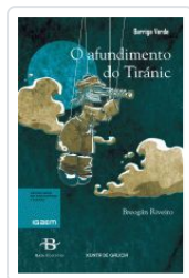
O AFUNDIMENTO DO TIRANIC BREOGAN RIVEIRO