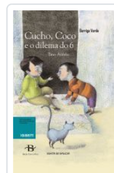
CUCHO, COCO E O DILEMA DO 6 TINO ANTELO