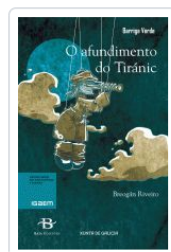
O AFUNDIMENTO DO TIRANIC BREOGAN RIVEIRO