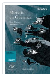
MISTERIO EN GUERNICA XOSE MANUEL FERNANDEZ CASTRO