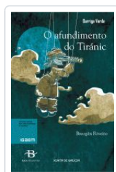
O AFUNDIMENTO DO TIRANIC BREOGAN RIVEIRO