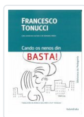
CANDO OS NENOS DIN BASTA! FRANCESCO TONUCCI