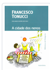
A CIDADE DOS NENOS FRANCESCO TONUCCI