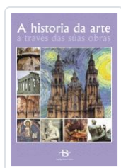
A HISTORIA DA ARTE (CD-ROM) VV.AA