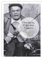
FLORENTIO,CEGO DOS VILARES VV.AA.