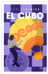
EL CUBO CARLOS ALMIRA