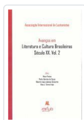
AVANÇOS EM LITERATURA E CULTURA BRASILEIRAS.SÉCULO XX.VOL.2 ASSOCIAÇÃO INTERNACIONAL DE LUSITANISTAS