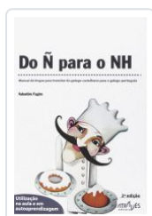
DO Ñ PARA O NH (2ªED) VALENTIM FAGIM