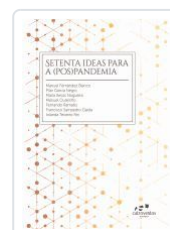
SETENTA IDEAS PARA A (POS)PANDEMIA AA.VV.