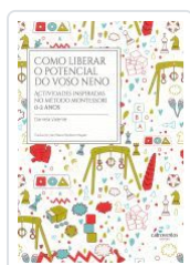
COMO LIBERAR O POTENCIAL DO VOSO NENO DANIELA VALENTE