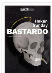
BASTARDO HAKAN GUNDAY