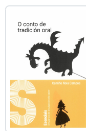
O CONTO DE TRADICIÓN ORAL CAMINO NOIA CAMPOS