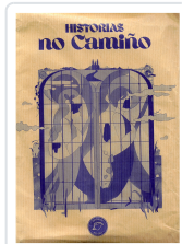
HISTORIAS NO CAMIÑO (BOLSA LIBRO+ AGASALLOS) AA.VV.