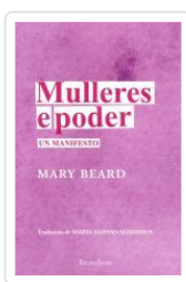
MULLERES E PODER MARY BEARD