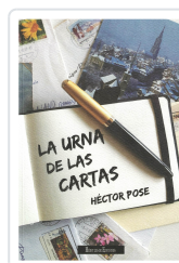
LA URNA DE LAS CARTAS HÉCTOR POSE PORTO