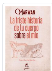
LA TRISTE HISTORIA DE TU CUERPO SOBRE EL MÍO MARWAN