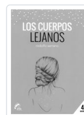
LOS CUERPOS LEJANOS RODOLFO SERRANO