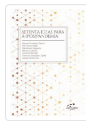
SETENTA IDEAS PARA A (POS)PANDEMIA AA.VV.