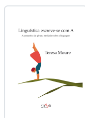
LINGUÍSTICA ESCREVE-SE COM A TERESA MOURE