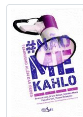
# NAO ME KAHLO.FEMINISMO ALEM DAS REDES VV.AA.