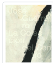
JOSÉ GUERRERO . LA COLECCIÓN DEL CENTRO JOSÉ GUERRERO