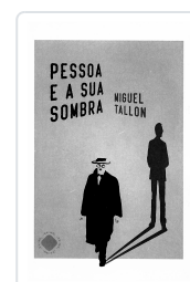
PESSOA E A SU SOMBRA MIGUEL TALLÓN