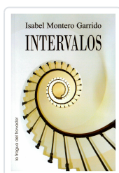
INTERVALOS ISABEL MONTERO GARRIDO