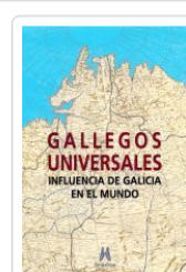
GALLEGOS UNIVERSALES VV.AA.: ALFONSO EIRE (COORD.)