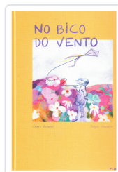
NO BICO DO VENTO GOLMAR, CHARO