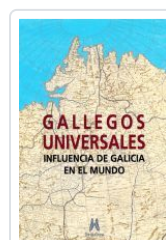
GALLEGOS UNIVERSALES VV.AA.: ALFONSO EIRE (COORD.)