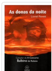
AS DONAS DA NOITE LIONEL REXES