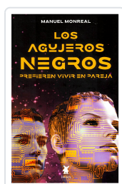
LOS AGUJEROS NEGROS PREFIEREN VIVIR EN PAREJA MANUEL MONREAL