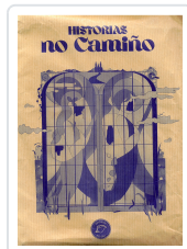
HISTORIAS NO CAMIÑO (BOLSA LIBRO+ AGASALLOS) AA.VV.