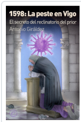
1598: LA PESTE EN VIGO ANTONIO GIRÁLDEZ