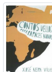
CONTOS VELLAS PARA RAPACES NOVOS XOSE NEIRA VILAS