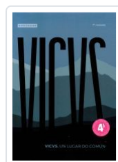
VICVS. UN LUGAR DO COMUN BETO LUACES