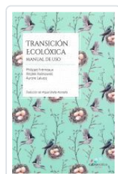
TRANSICIÓN ECOLÓXICA PHILIPPE FRÉMEAUX;WOJTEK KALINOWKI;AURORE LALUCQ