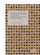
PERMACULTURA ALEXANDRE GRANDE BABARRO