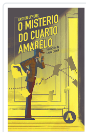
O MISTERIO DO CUARTO AMARELO LEROUX, GASTON