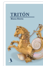
TRITÓN BLANCA RIESTRA