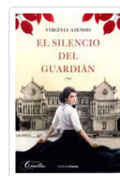
EL SILENCIO DEL GUARDIÁN VIRGINIA ASENSIO