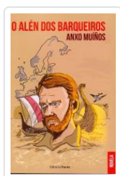
O ALÉN DOS BARQUEIROS ANXO MUIÑOS