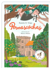
PERNASCOCHAS RAMÓN D.VEIGA