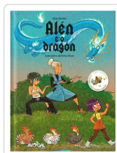
ALÉN E O DRAGÓN OLAIA SENDÓN