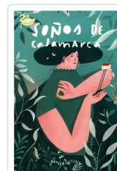
SOÑOS DE CAJAMARCA AA.VV