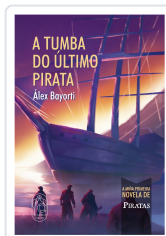
A TUMBA DO ÚLTIMO PIRATA ALEX BAYORTI