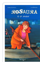
ROSAURA E O MAR ISABEL BLANCO