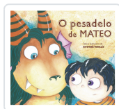
O PESADELO DE MATEO ESTEFANÍA PADULLÉS ESTÉVEZ