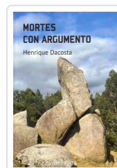
MORTES CON ARGUMENTO HENRIQUE DACOSTA