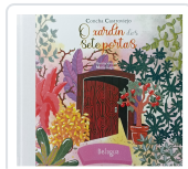
O XARDÍN DAS SETE PORTAS CONCHA CASTROVIEJO