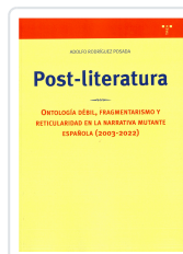
POST-LITERATURA ADOLFO RODRÍGUEZ POSADA