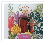
O XARDÍN DAS SETE PORTAS CONCHA CASTROVIEJO