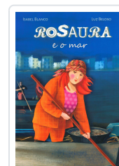
ROSAURA E O MAR ISABEL BLANCO